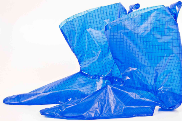
Abb.: Alex Gehrke, Balenciaga II, 2017