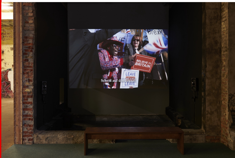
Abb.: Jeremy Deller, Putin's Happy, Video, 2019, Foto: Walther Le Kon | HALLE 14, 2020