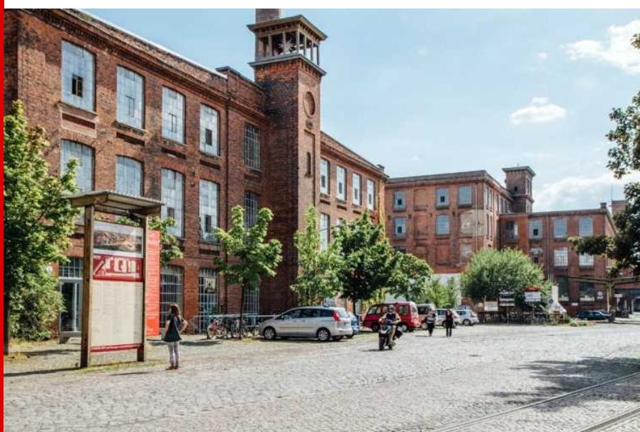
Abb.: Leipziger Baumwollspinnerei, Foto: Uwe Walter, 2014