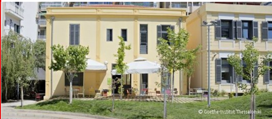
Abb.: Sitz des Goethe-Instituts in der Nähe der Uferpromenade in Thessaloniki, Foto: Goethe-Institut Thessaloniki