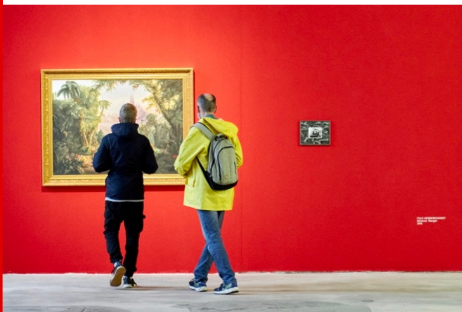
Abb.: Falk Messerschmidt, Reverse Merger (2018), Foto: HALLE 14 | Walther Le Kon, 2020