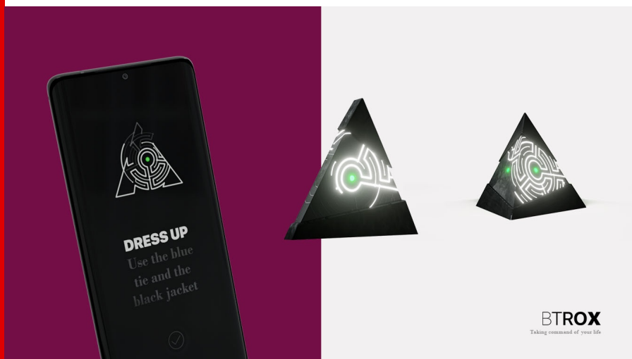
Abb.: Yonlay Cabrera, Btrox, digitale Grafik, Foto: Yonlay Cabrera, 2021