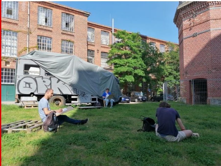
Abb.: Impression des Plein-Air-Zeichenzirkels, Foto: HALLE 14, 2021