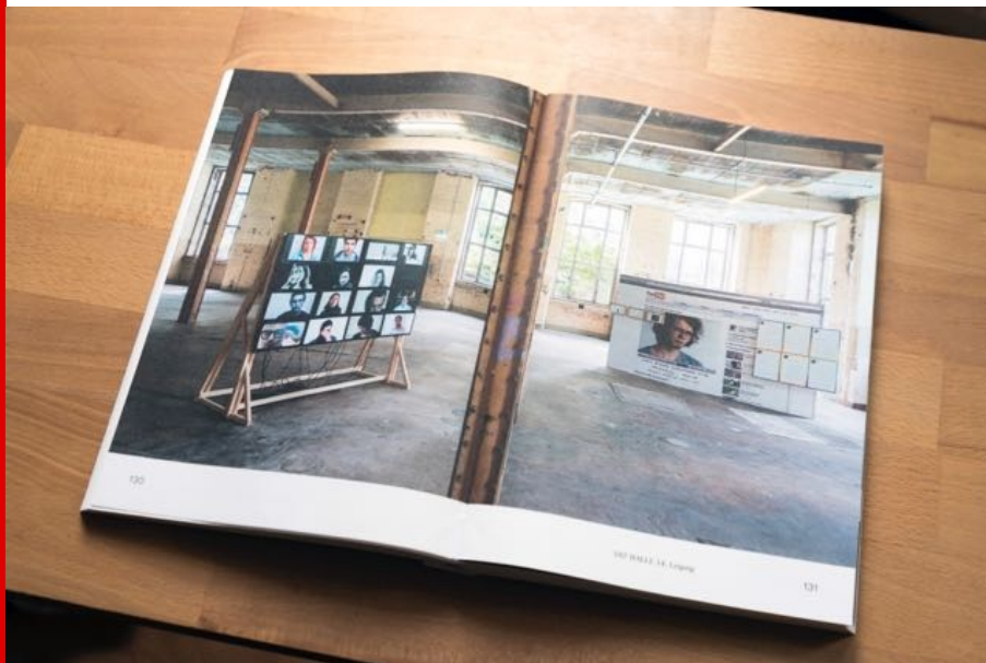
Abb.: Blick ins neue Künstlerbuch von Sven Bergelt