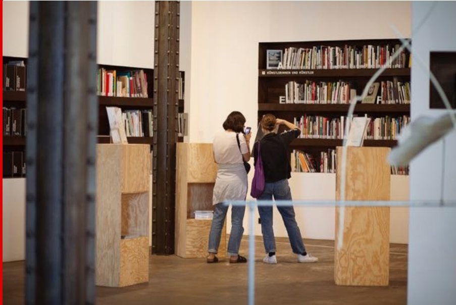
Abb.: Die sieben Publikationen der Ausstellung stehen in der Bibliothek bereit