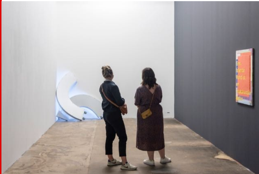
Abb.: Blick in die Ausstellung, Foto: HALLE 14 | Büro für Fotografie, 2021