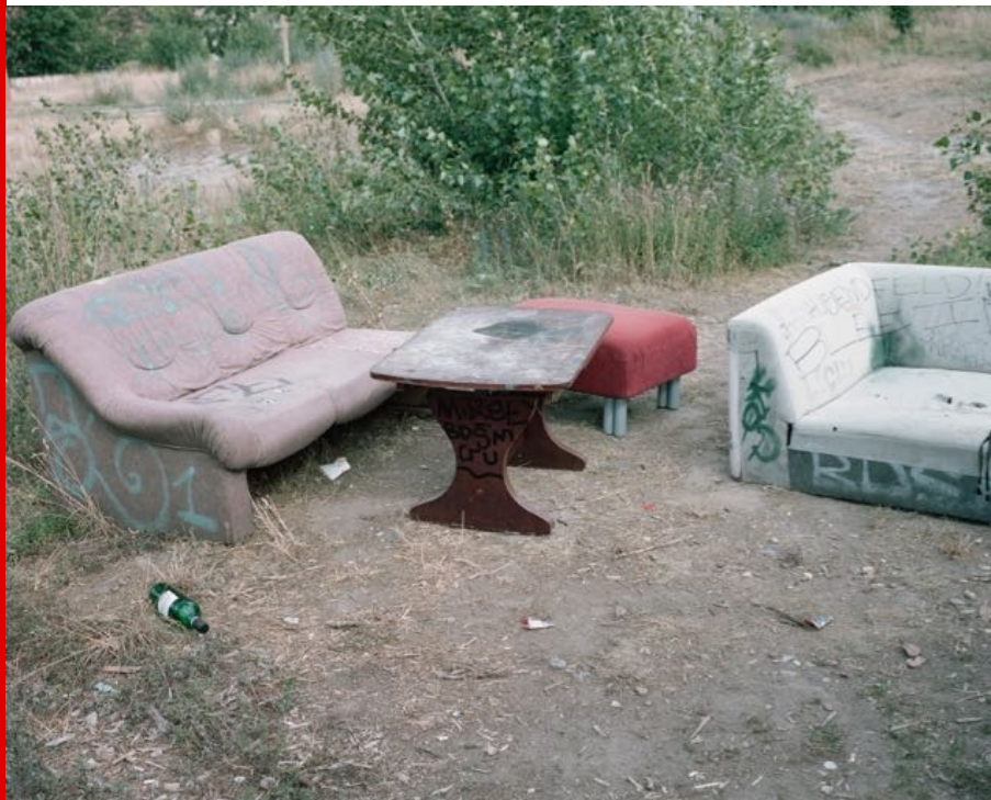
Abb.: Falk Haberkorn, Plateau, Fotoserie, fortlaufend.