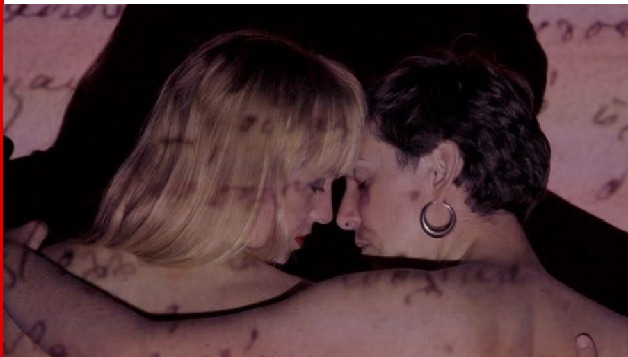
Abb.: Klara Charlotte Zeitz, Manifesto of Transformation, 5. Film: Utopia (Videostill), 2021.